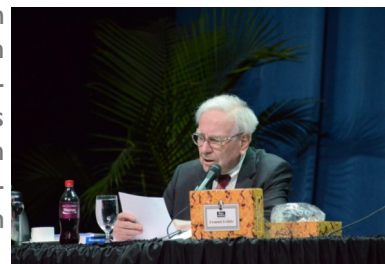
Warren Buffett, Value Investorenlegende und Multimilliardär: „Price is what you pay - Value is what you get“

Die Strategie der Anlagepolitik für die Global Value Polizza orientiert sich an der Theorie von Benjamin Graham, dem Urvater des Value Investings und der praktischen Umsetzung durch Warren Buffett, dem erfolgreichsten Investoren aller Zeiten. Ein Value-Investor orientiert sich am wirklichen Wert der Unternehmen und ist einer index- oder trendorientierten Anlagepolitik überlegen. Graham erkannte bereits schon vor 90 Jahren, dass Aktienmärkte besonders auf kurze Sicht von menschlicher Psychologie beeinflusst werden und somit nicht immer effizient funktionieren. Value-Investoren hingegen verhalten sich grundsätzlich antizyklisch und setzen meist auf Aktien, die nicht unbedingt zu den aktuellen Marktfavoriten zählen. Aktien sind dann billig, wenn die Nachrichten aus dem Unternehmen eher schlecht sind. Die Masse der anderen Investoren setzt auf Titel, bei denen ein positiver Nachrichtenfluss erwartet wird. Die Wertsteigerung ist aber bei Aktien, die nicht zu den Favoriten zählen, oft deutlich höher.